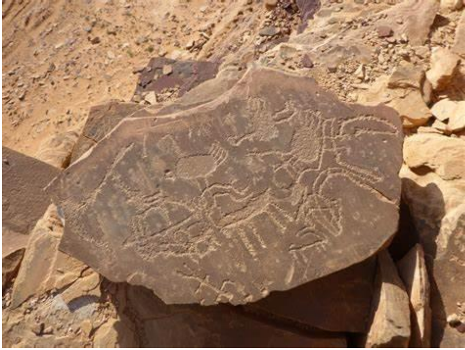
صورة (6): (من النقوش على صخور العلا بالخط النبطي)