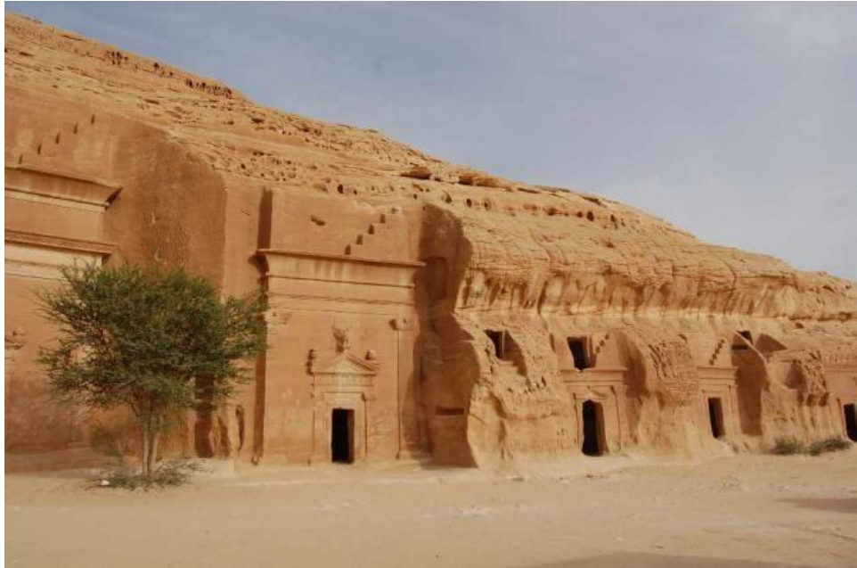
صورة (5): (مدائن صالح)