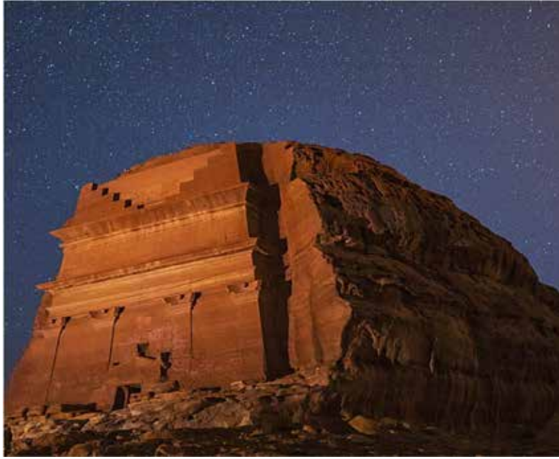
صورة (2): (مدائن صالح)