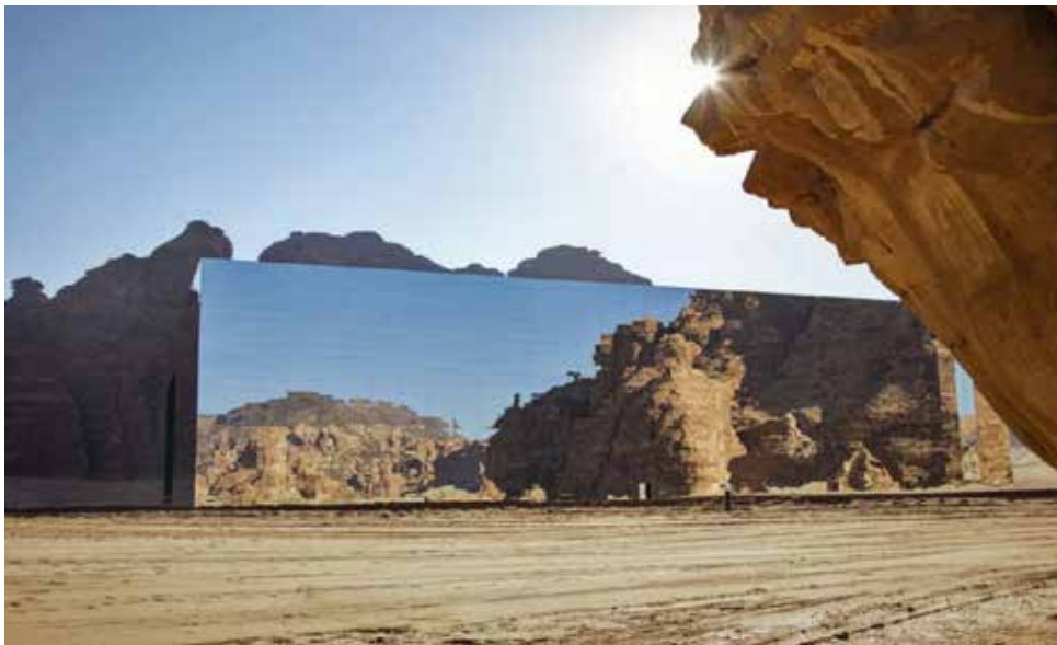
صورة (9): (مسرح مرايا من أشهر المعالم الحديثة في العلا)

أما في وقتنا الحالي فقد تطورت العلا على مدى السنين حتى عصرنا هذا حتى أصبحت من أشهر المدن السياحية والثقافية والأثرية على مستوى العالم، ومقصداً للاستجمام والترفيه، وأنشأت بها الهيئة الملكية لمحافظة العلا بعض المحميات كمحمية شرعان الطبيعية، ومن الجدير الإشارة إلى أنه "في العام 2008، صنفت اليونسكو مدينة الحجر التاريخية، كأول موقع سعودي يدخل إلى قائمة التراث العالمي في تصنيف اليونسكو" (3) .