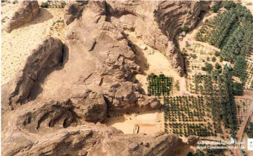
صورة (8): (مزارع النخيل في العلا)

أما في وقتنا الحالي فقد تطورت العلا على مدى السنين حتى عصرنا هذا حتى أصبحت من أشهر المدن السياحية والثقافية والأثرية على مستوى العالم، ومقصداً للاستجمام والترفيه، وأنشأت بها الهيئة الملكية لمحافظة العلا بعض المحميات كمحمية شرعان الطبيعية، ومن الجدير الإشارة إلى أنه "في العام 2008، صنفت اليونسكو مدينة الحجر التاريخية، كأول موقع سعودي يدخل إلى قائمة التراث العالمي في تصنيف اليونسكو" (3) .