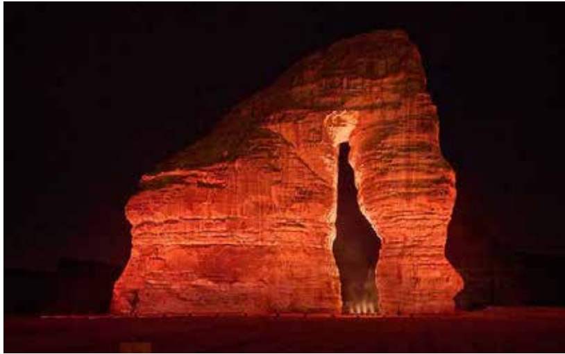
صورة (3): (جبل الفيل، من أشهر المعالم الجبلية الطبيعية في العلا)