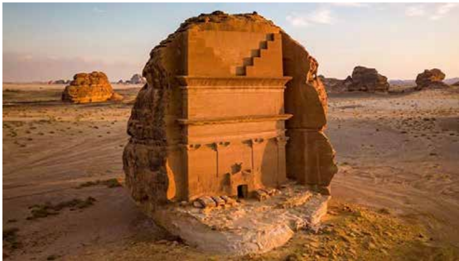
صورة (1): مدائن صالح

وهذه بعض الصور للمناطق التاريخية في العلا: